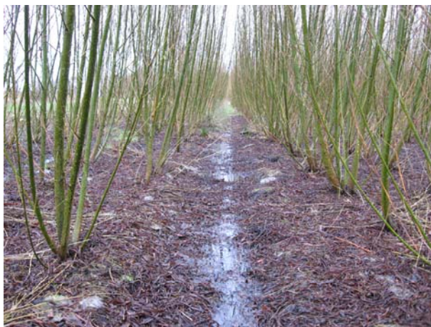
Figur 2 Pil trives bl.a. i forholdsvis fugtig jord og kan tåle oversvømmelse i kortere eller længere perioder.

Det er specielt vigtigt, at kvik og andet rodgrudt er bekæmpet før plantning. Græsser og frøgrudt