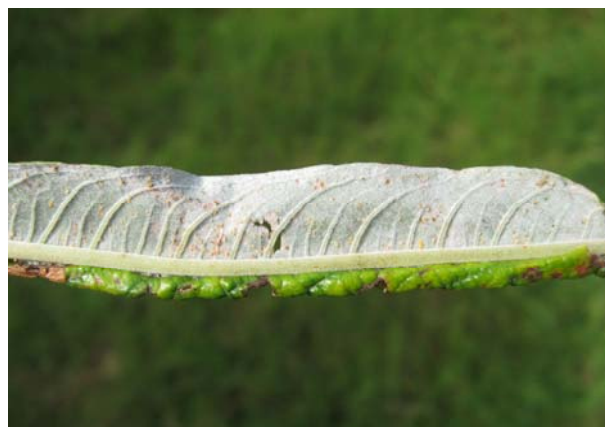
Figur 6 Rustangreb.

Rust er den mest udbredte sygdom og den værste skadevolder i de ældre pilekloner.