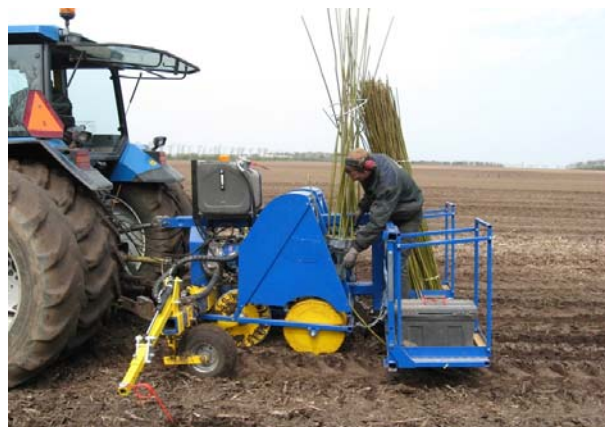
Figur 3 Plantning af pil.