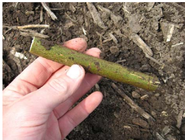
Figur 5 Stikling på ca. 20 cm længde.