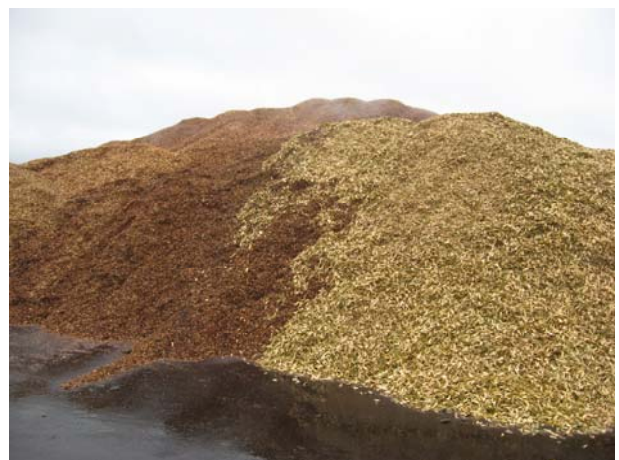
Figur 8 Lagring af flis på fast bund sikrer, at der ved læsning ikke blandes jord i flisen.