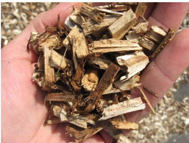
Figur 9 Pileflis.

Ved opbevaring af flis i en markstak i 5 måneder vil der typisk opstå et tørstofstab på 15-25 pct. Samtidig vil der udvikles en voldsom svampeflora i flisen, hvilket kan være uheldigt for arbejdsmiljøet.