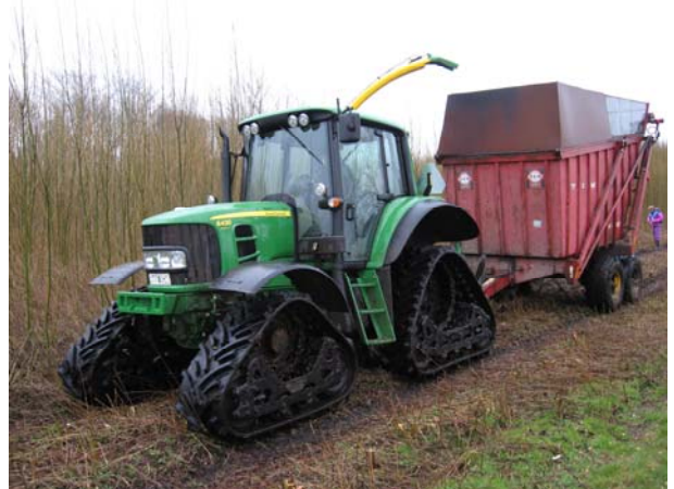
Figur 7 Montering af bæltter kan være en hjælp til at kunne høste pil på fugtige arealer.

Dette system er velegnet, når flisen kan leveres direkte fra marken til forbrug på et kraftvarmeværk i selve høstsæsonen.