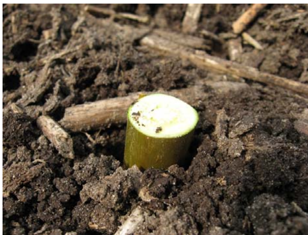
Figur 4 Stiklinger skal højst stikke et par cm op over jordoverfladen.

Fosfor og kalium kan tilføres på én gang for hver høstperiode. Det vil sige i plantningsåret eller første produktionsår og efter høst.